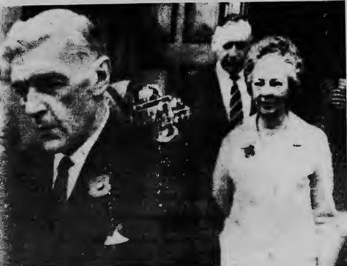
SALISBURY, RHODESIA--Gobernador general británico de Rhodesia, Sir Humphrey Gibbs siguió pa su posesión, a salir de catedral Salisbury después de un misa, Sir Humphrey, con a ser pidi pa su cargo, a ninga di hasi esaki. El a declara gobierno nobo di Rhodesia ilegal.